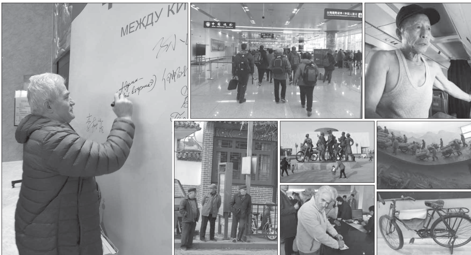
Всякий раз я с удовольствием оставлял автографы на стендах проходивших мероприятий; он за тем табло меня и «потеряли»; один из пассажиров нашего «Боинга»; китайские ветераны с интересом наблюдали за передвижениями нашей группы; видеть в музеях Китая взрослых с детьми — обычное дело; «Все для фронта, все для победы» — этот лозунг был главным лозунгом и в Китае во время войны с Японией; в офисе «Почты Китая»; на таких велосипедах китайские почтальоны развозили корреспонденцию.

К моему удивлению, салон Боинга-767 оказался полупустым. И этим рейсом, судя по всему, летели бывалые китайские пассажиры, умеющие завоевывать если не воздушное пространство вообще, то пространство воздушного судна точно. Кто-то спал, заняв весь ряд пустовавших кресел, кто-то умудрился, свернувшись калачиком, дрыхнуть на одной шестой части сиденья. Иные, вы-