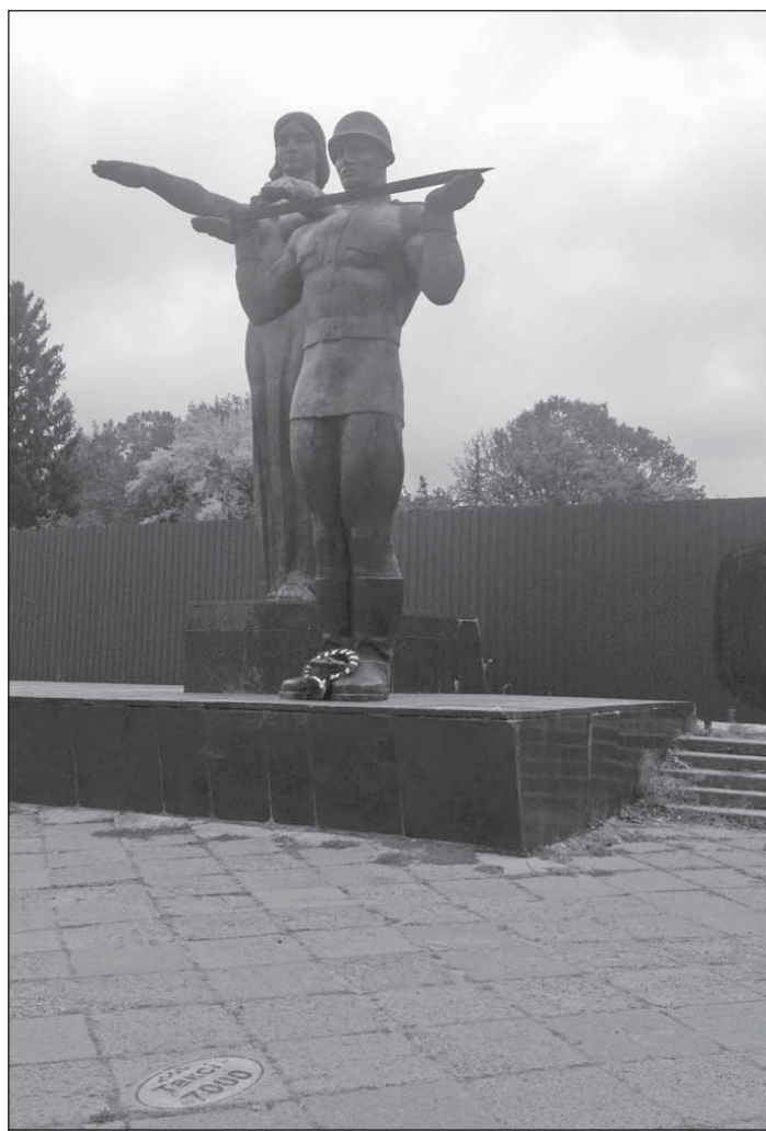
На заборе, опоясывающем Монумент Славы, появились непристойные надписи и белый камень «в память павших воинов АТО».

Валерий ГРОМАК | спецкор «НВ» | капитан 1 ранга в отставке