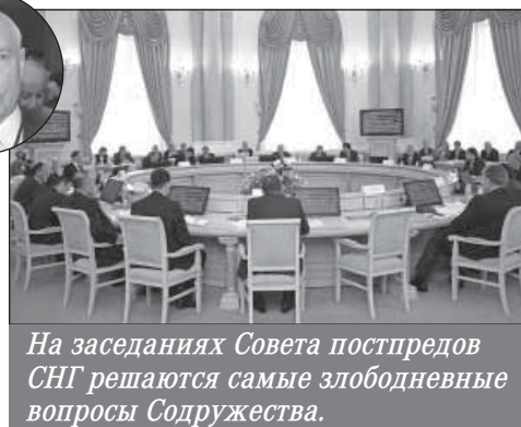
На заседаниях Совета постпредов СНГ решаются самые злободневные вопросы Содружества.

— Сергей Николаевич, какие из событий в рамках Содружества были наиболее важными в последнее время?