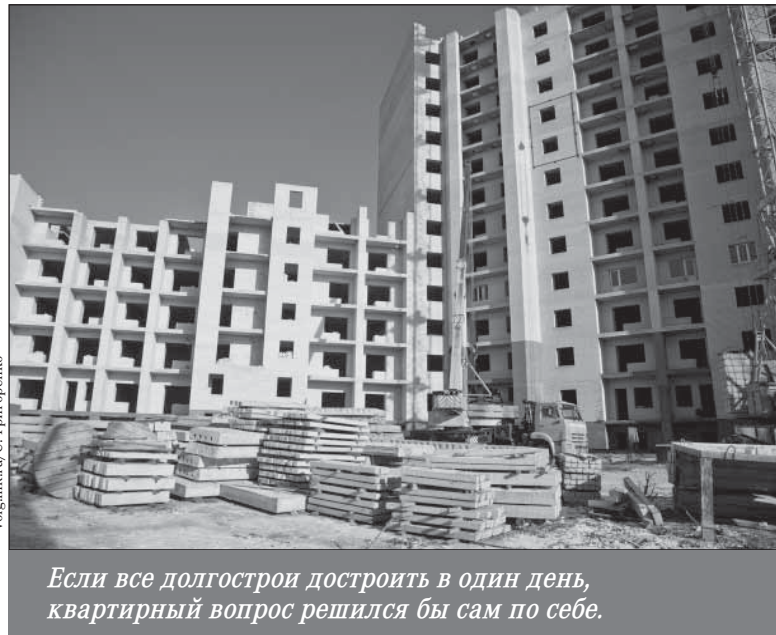
Если все долгострои достроить в один день, квартирный вопрос решился бы сам по себе.

Дело в том, что деньги простых покупателей по новому закону привлекать по-прежнему можно. Только если раньше эти деньги шли застройщику, то теперь деньги за покупку квартиры на стадии строительства покупателю нужно будет нести в специально аккредитованные банки. Там ваши деньги положат на специальный депозит. Застройщик сможет получить эти деньги у банка, но под процент! Сегодня застройщик берет в банке в среднем под 20%, остальные 80% денег приносят дольщики. То есть благодаря новому закону стоимость