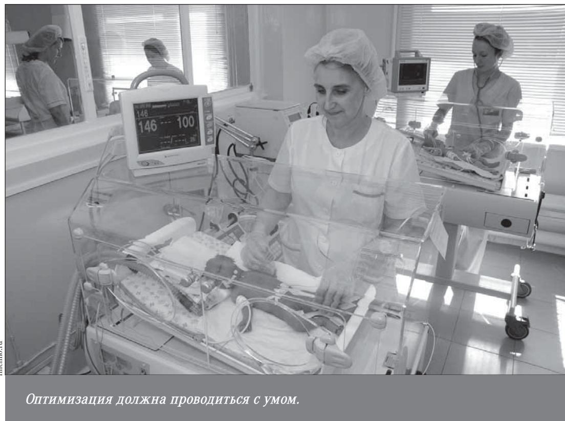
Оптимизация должна проводиться с умом.

Так, в новом перинатальном центре Орла за две недели января 2016 года умерли сразу восемь младенцев.