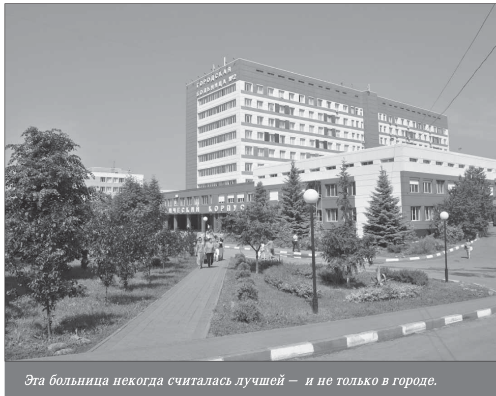
Эта больница некогда считалась лучшей — и не только в городе.