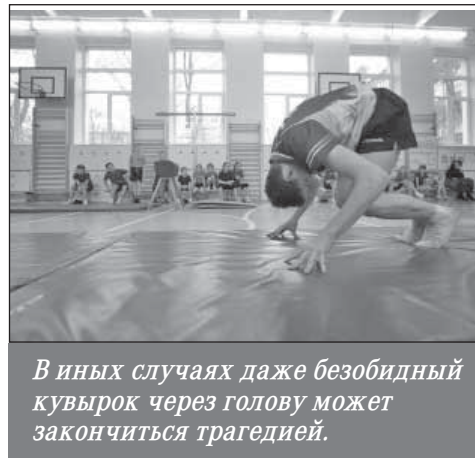
В иных случаях даже безобидный кувырок через голову может закончиться трагедией.

О том, как предотвратить гибель российских детей на уроках физкультуры, размышляют эксперты