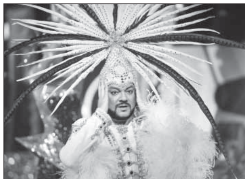
Пугачева и Киркоров рискуют пролететь мимо «огонька».

Любопытно, что продюсер Максим Фадеев, который давно находится в «контрах» с Первым каналом, уже объявил, что его артисты в новогодних эфирах участвовать не будут. Ни «Серебро», ни Наргиз. Даже если имена попадут в