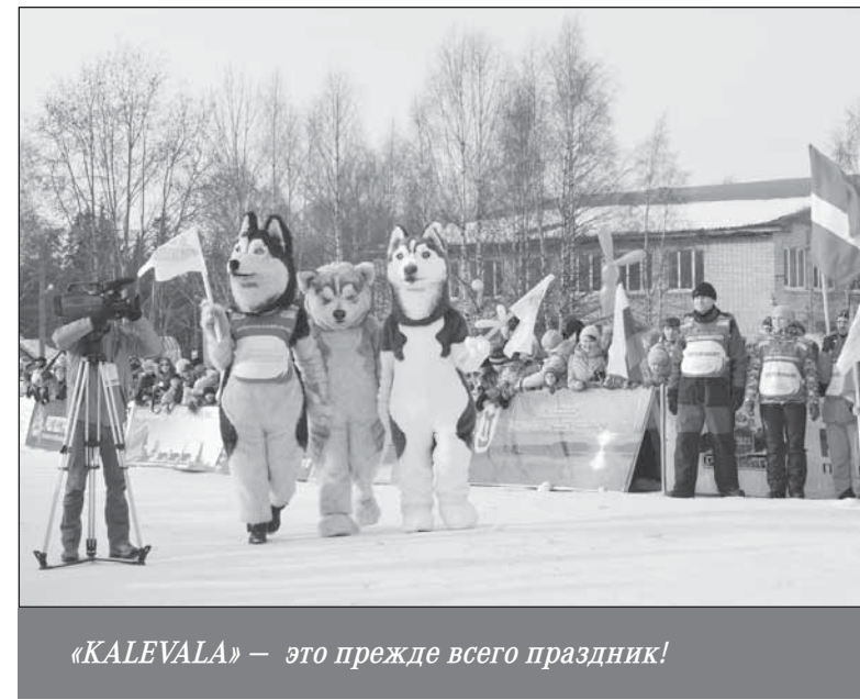
«KALEVALA» — это прежде всего праздник!