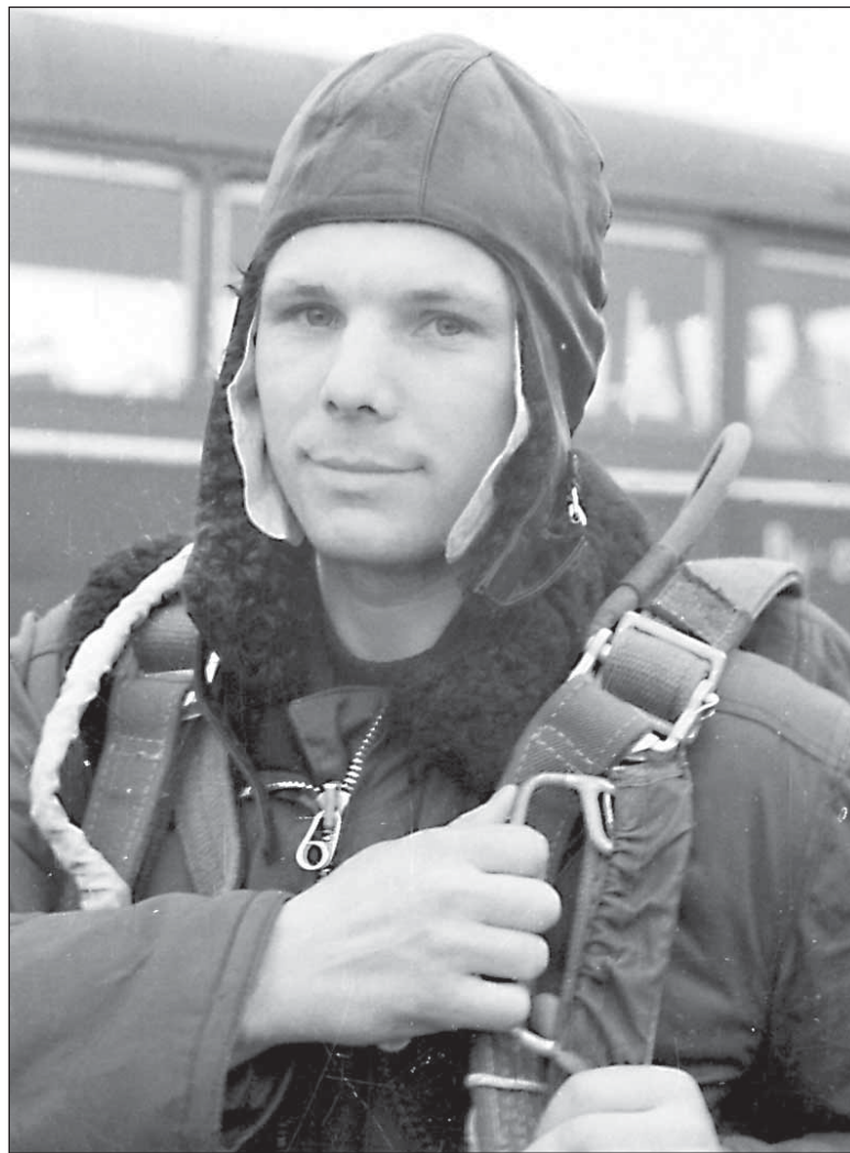
Пока он просто Юра...

Оказалось, что у нее еще нет имени — пока она значилась под каким-то испытательным номером. Посылать в космос пассажира без имени, без паспорта? Где это видано! И тут нам предложили придумать ей имя. Перебрали десяток популярных собачьих кличек. Но они все как-то не подходили к