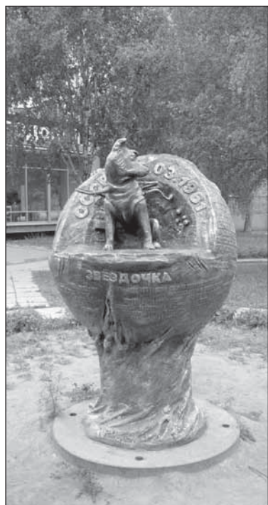
Собачке, имя которой придумал Гагарин, поставили памятник.