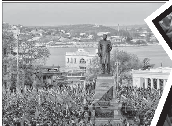
Последние события на Украине ускорили вхождение Крыма и Севастополя в состав Российской Федерации.