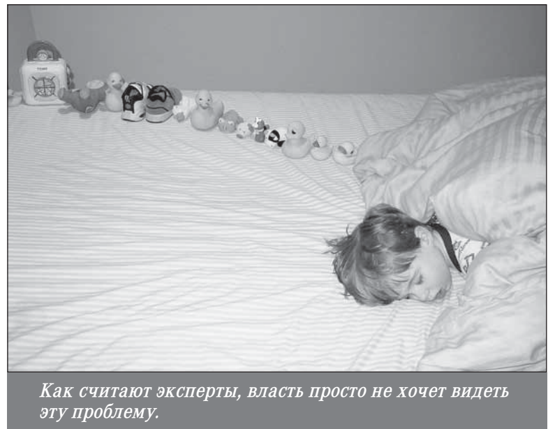
Как считают эксперты, власть просто не хочет видеть эту проблему.