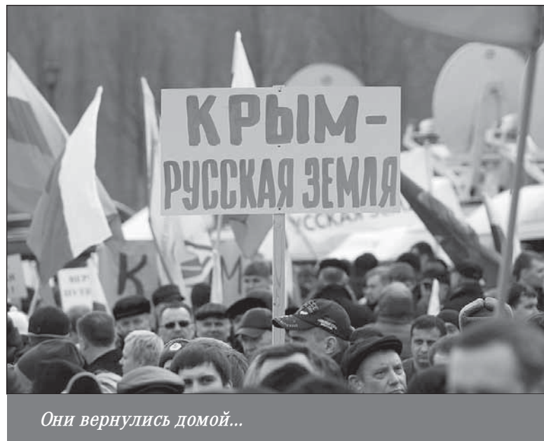
Они вернулись домой...

го сектора» не признают Генерального прокурора и министра МВД. Поэтому, когда бандиты на днях забросали «коктейлями Молотова» областную и городскую прокуратуры в Виннице, а также здешние облуправление и райотделы милиции (хотя в них теперь работают исключительно свои по духу выдвинуты), то преступников никто не стал искать.