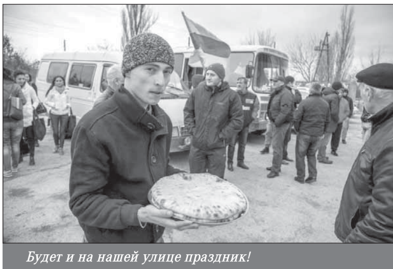
Будет и на нашей улице праздник!

С географической точки зрения Южная Осетия де-факто является неотъемлемой частью Евразийского континента, а де-юре — и евразийского экономического пространства, если иметь в виду наличие более семидесяти межправительственных