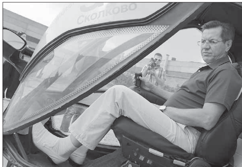
Александр Жилкин серьезно намерен превратить Астраханскую область в еще одно Сколково.