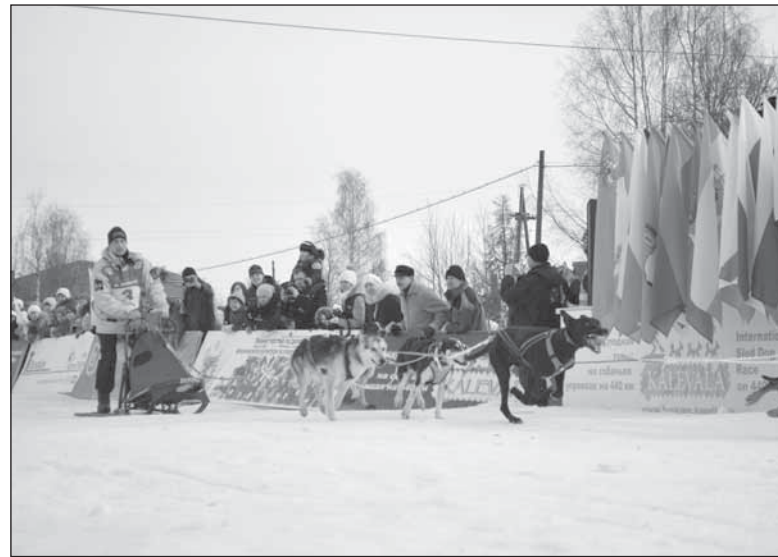
Главное — не награда, а участие.

Причем, что самое интересное, для участников «KALEVALA-2014» призовой фонд соревнований, составляющий достаточно солидную сумму — один миллион рублей, далеко не главное. И с ними согласны их четвероногие питомцы, лающие и воющие на