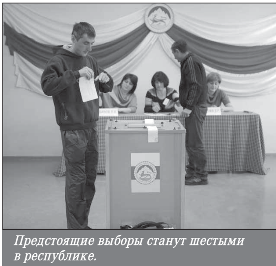
Предстоящие выборы станут шестыми в республике.

прогрозинскую позицию в этом вопросе, а также за осуждение действий российских «оккупационных» войск.